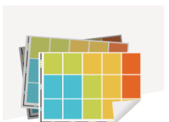
VOTRE DIALOGUE PARTIES PRENANTES